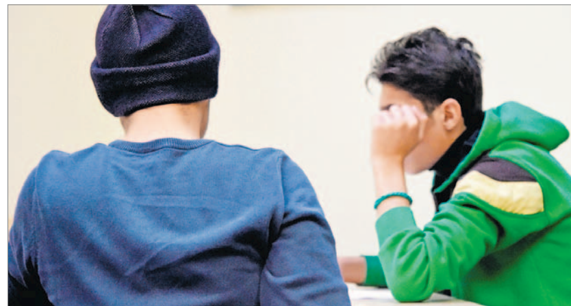
In Fürth besuchen alle minderjährigen Flüchtlinge die Schule – bayernweit beträgt die Quote um die 65 Prozent.